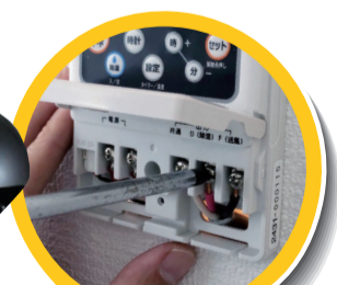
端子ねじを確実に締め直す