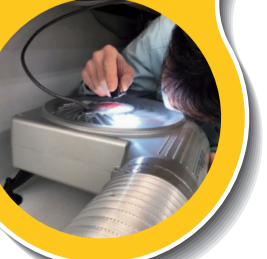
ファンに異物や羽の欠けが無い確認する